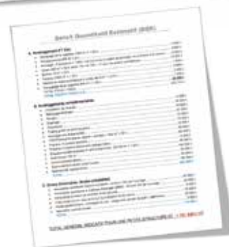
NB : données fictives